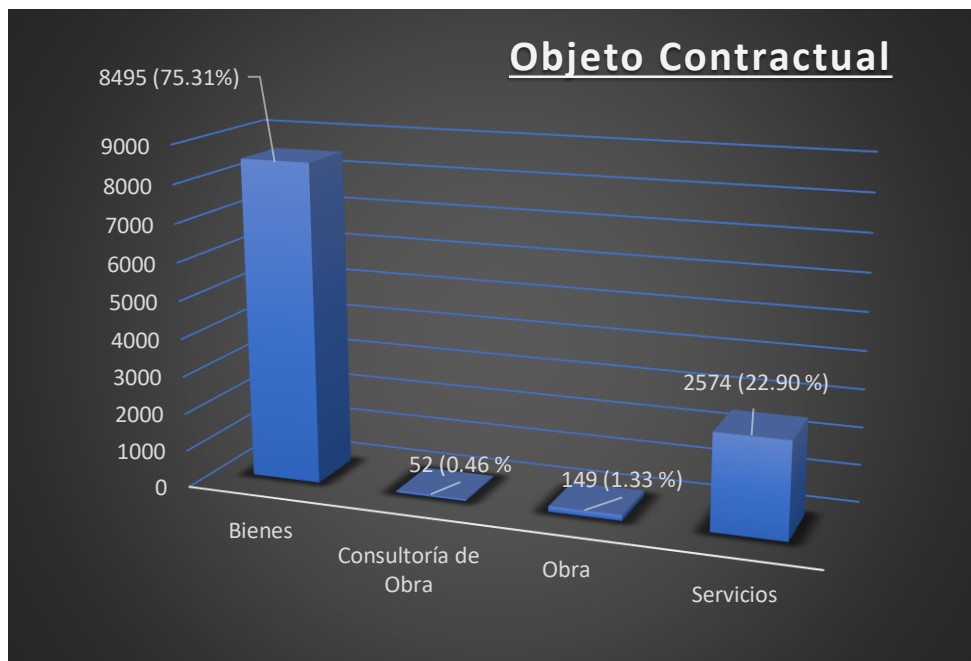
Gráfico 1: Elaboración propia

Como se puede verificar, más del 75 % de las contrataciones directas que se realizaron durante el periodo de pandemia, tienen como objeto contractual la adquisición de bienes : guantes, mascarillas, material de aseo y limpieza entre otros 6 . Sigue en importancia la adquisición de servicios , las mismas que se han realizado en casi un 23 % del total. Finalmente, las contrataciones referidas a Consultoría de Obra y Obra se encuentran en porcentajes muy bajos (0.46 % y 1.33 %).