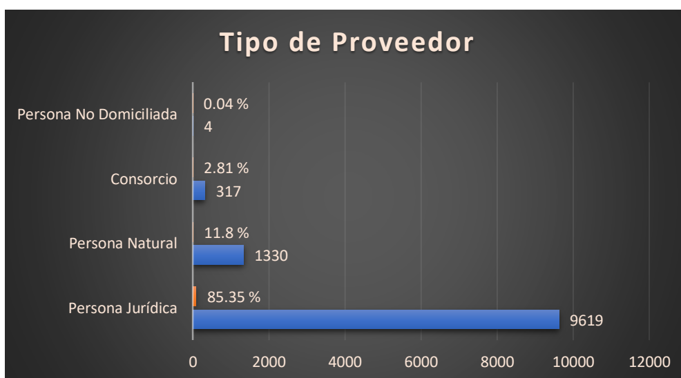
Gráfico 3: Elaboración propia

Tal como vemos en el Gráfico - 3 , más del 85 % de las CDs han sido adjudicadas a personas jurídicas, seguidas de las personas naturales con un 11.8 % y los consorcios en un porcentaje mucho menos significativo (2.81%).